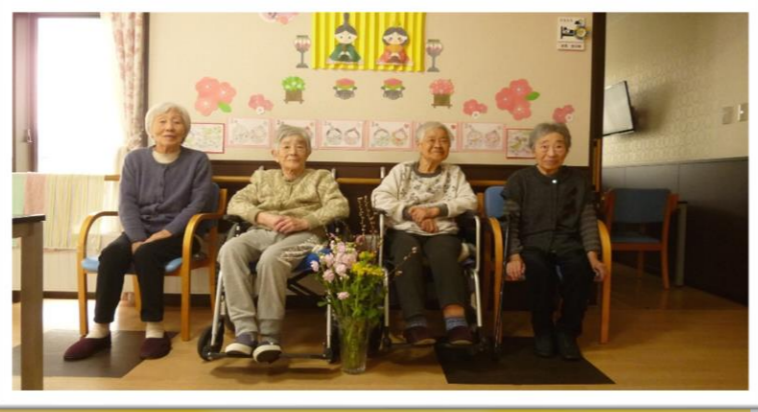
手作りひな人形の前で記念撮影！ちょっと緊張している方もいますが、いい感じです(*^▽^*)