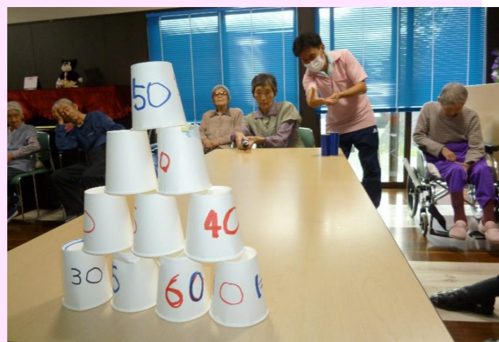
射的ゲーム！スナイパーになりきっているIさん