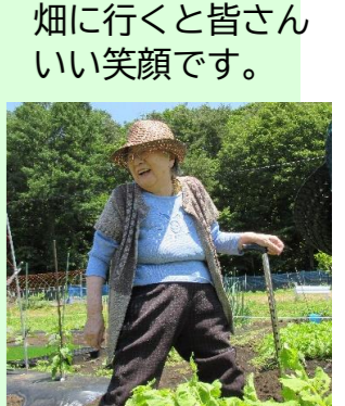
畑に行くと皆さん いい笑顔です。

畑の真ん中に車椅子用のスロープを作りました(*^^)v車椅子の利用者様にも収穫を楽しみましょう！