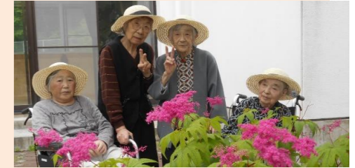
お散歩中にパシャリ！集合写真！