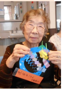
七夕飾り完成！ きれいに出来てます