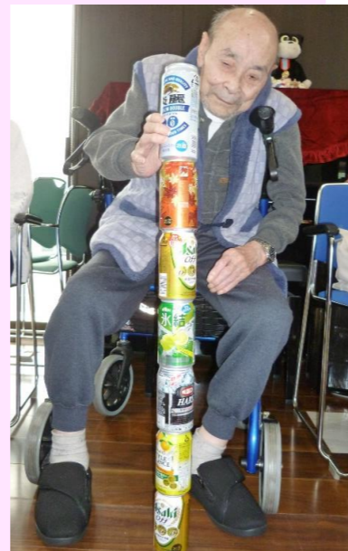
空き缶を積み上げ 手先のトレーニング！