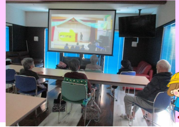
米内幼稚園様よりクリスマス会のDVDを頂きました。 利用者皆さんでDVD鑑賞中！ 「かわいい～」の声が(^^)